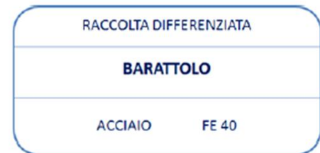
ESEMPIO ETICHETTA AMBIENTALE

... di conseguenza il cittadino completa l'atto d'acquisto con una corretta separazione dei propri rifiuti di imballaggio